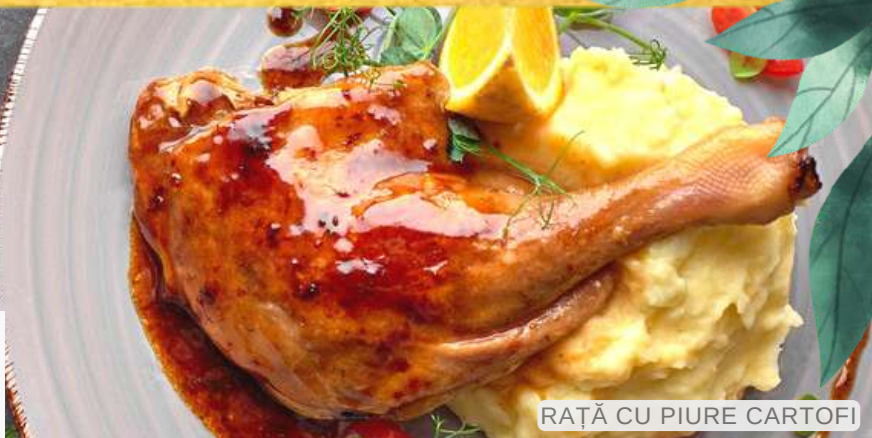
RAȚĂ CU PIURE CARTOFI