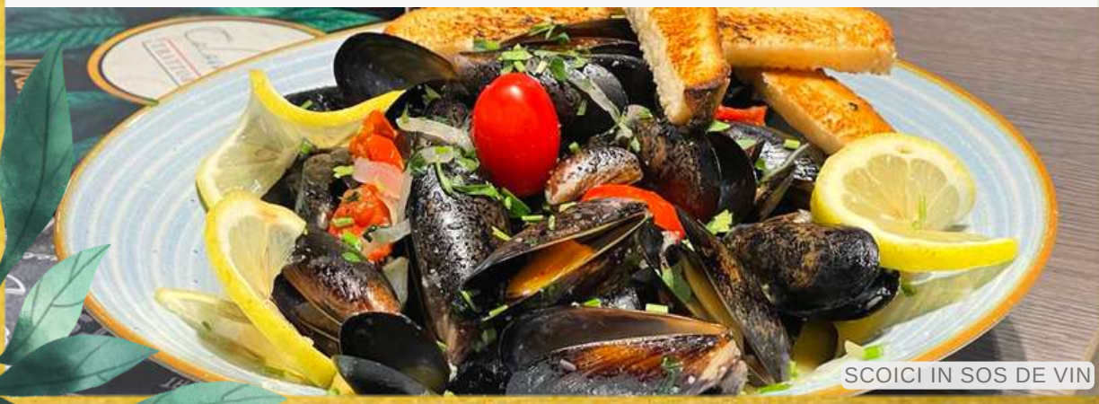
SCOICI IN SOS DE VIN

Informații nutriționale 100g: Valoare Energetică (kJ/kcal): 532.7 / 127, Grăsimi (g): 4.4 din care: Acizi grași saturați (g) 0.6, Glucide (g): 9.8 din care: Zaharuri (g): 0.4, Proteine (g): 12.5, Sare (g): 0.1 Alergeni: Pește