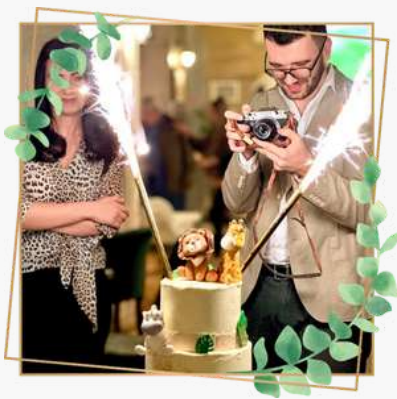
ZILE DE NAȘTERE